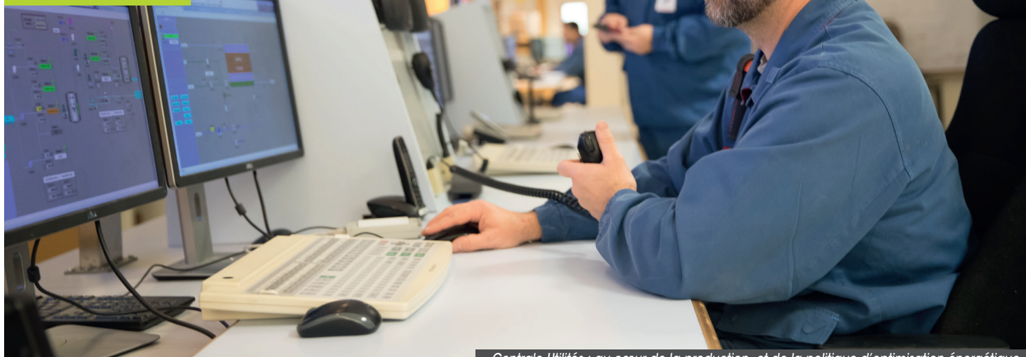
Centrale Utilités : au cœur de la production et de la politique d'optimisation énergétique