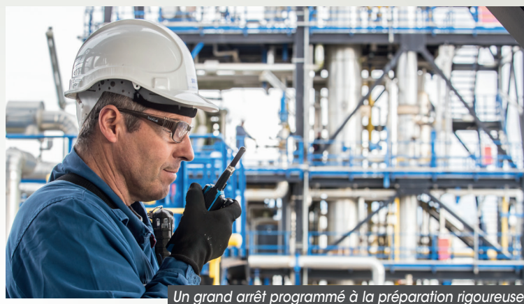
Un grand arrêt programmé à la préparation rigoureuse

L'investissement est considérable : 4.7M€ pour SOBEGI et les enjeux de réussite le sont tout autant : garantir