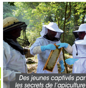
Des jeunes captivés par les secrets de l'apiculture

SOBEGI A INVITÉ DES JEUNES HANDICAPÉS À COLLECTER LE MIEL DU RUCHER INDUSLACQ.