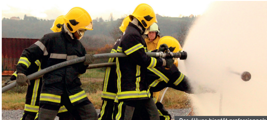
Des élèves bientôt professionnels

LA FORMATION BAC PRO LA PLUS PRIÉE DE L'ACADÉMIE INCLUT TROIS SEMAINES DE STAGE À SOBEGI.