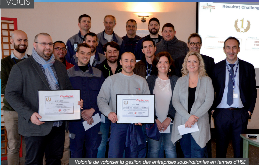
Volonté de valoriser la gestion des entreprises sous-traitantes en termes d'HSE et de récompenser leur professionnalisme : équipes TROISEL et ACTEMIUM.